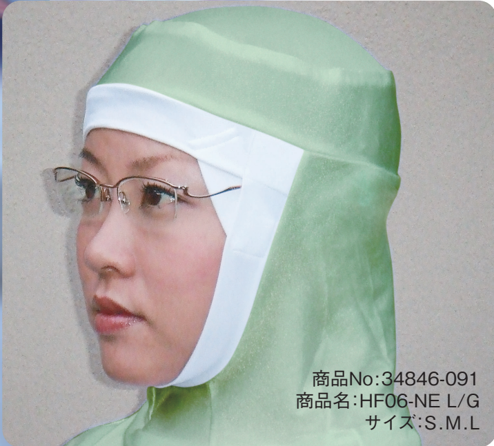
商品No: 34846-091 商品名: HF06-NE L/G サイズ: S.M.L